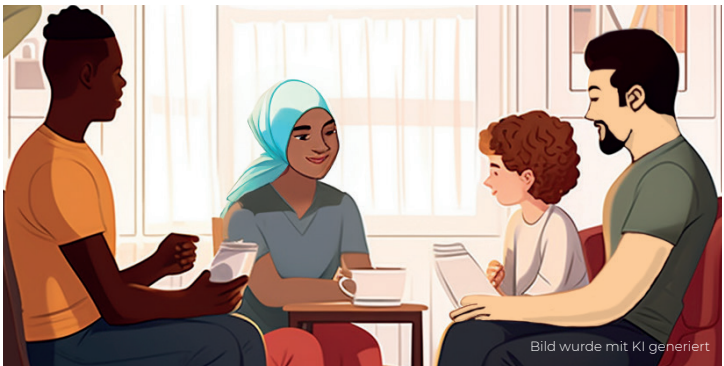
Bild wurde mit KI generiert

Arabisch, Deutsch, Englisch, Französisch, Hausa, Igbo, Pidgin, Portugiesisch, Spanisch, Twi - andere Sprachen auf Anfrage